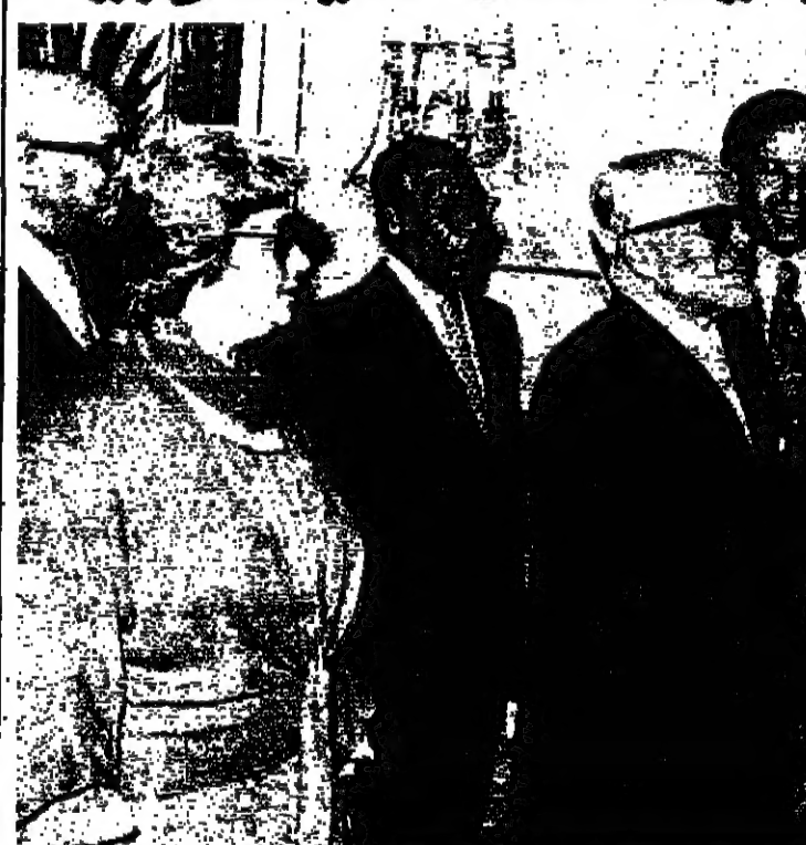
الرئيس الجديد بورقيبة يستقبل الشيخ بيار الجميل محافظ بحرمه السيدة وسيلة، ورئيس الوزراء الهادي نويرة ورئيس مجلس الأمة السابق القديم.

جدا وذات نتيجة عملية. ما رايك ياخافي شورا الذي تم... المأمور هو التمييز وأن شاء الله... كل قرانا وإمكاننا للخروج من الحنة التي نحن فيها.